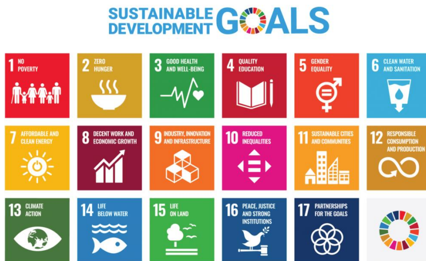
แผนภาพที่ 2 แสดง Sustainable Development Goals: SDGs

เป้าหมายการพัฒนาที่ยั่งยืน (Sustainable Development Goals: SDGs) มีทั้งหมด 17 เป้าหมาย (Goals) ภายใต้อันหนึ่งเป้าหมายจะประกอบไปด้วยเป้าหมายย่อย ๆ ที่เรียกว่า เป้าหมายย่อย (Targets) ซึ่งมีจำนวนทั้งหมด 169 เป้าหมายย่อย และพัฒนา ตัวชี้วัด (Indicators) จำนวน 232 ตัวชี้วัด (ทั้งหมด 244 ตัวชี้วัดแต่มีตัวที่ซ้ำ 12 ตัว) เพื่อติดตามความก้าวหน้าของเป้าหมายย่อยดังกล่าว